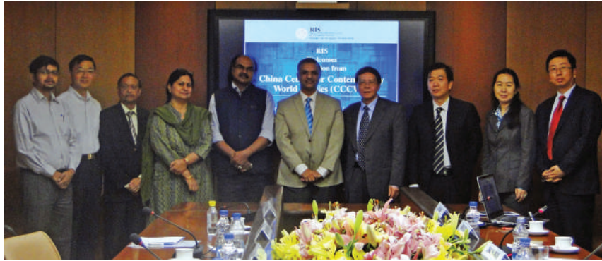
आरआईएस संकाय के सदस्यों के साथ चीनी प्रतिनिधिमंडल के सदस्य मंत्रणा करते हुए।

सहयोग के अवसरों को ध्यान में रखते हुए इन दोनों महत्वपूर्ण थिंक टैंकों की यह बैठक विशेष अहमियत रखती है। दौरे पर आए प्रतिनिधिमंडल के अनुरोध पर आरआईएस ने ब्रिक्स की भारतीय अध्यक्षता के दौरान वर्ष 2016 में आयोजित ब्रिक्स शैक्षणिक और सिविल सोसायटी फोरमों के कार्यक्रम एवं परिणामों से जुड़े विवरण साझा किए।