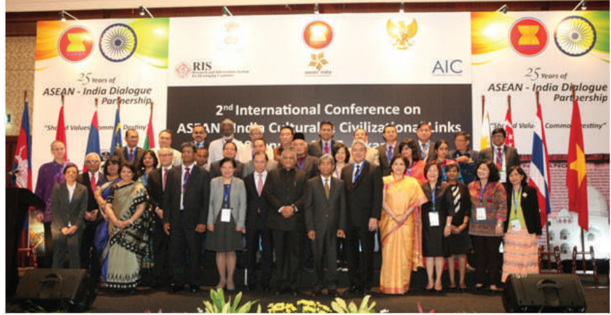
भारत और आसियान के बीच सांस्कृतिक एवं सभ्यतागत संबंधों पर आयोजित सम्मेलन में प्रतिभागी शिरकत करते हुए।