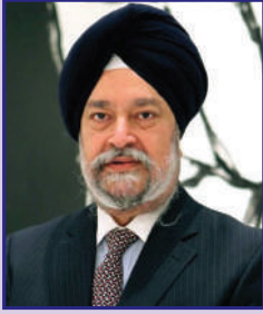
राजदूत हरदीप एस पुरी अध्यक्ष, आरआईएस

आरआईएस ने अपने नए अध्यक्ष का स्वागत किया