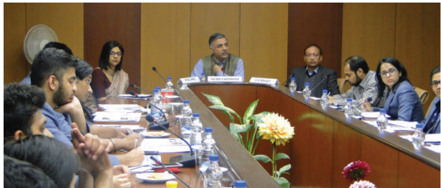
आरआईएस संकाय के सदस्यों के साथ संवादात्मक सत्र का आयोजन।