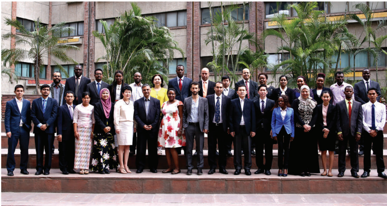
आरआईएस संकाय के सदस्यों के साथ आईआईडीपी पर आईटेक कार्यक्रम के प्रतिभागीगण।

अधिक जानकारी के लिए कृपया आरआईएस की वेबसाइट www.ris.org.in पर जाएं।