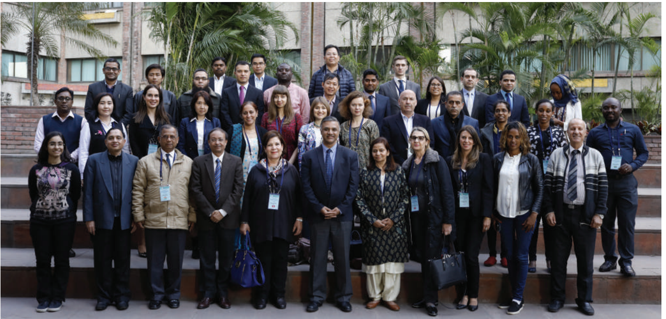
आरआईएस संकाय के सदस्यों के साथ विज्ञान कूटनीति पर आईटेक कार्यक्रम के प्रतिभागियों।